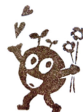
たねダンゴちゃん